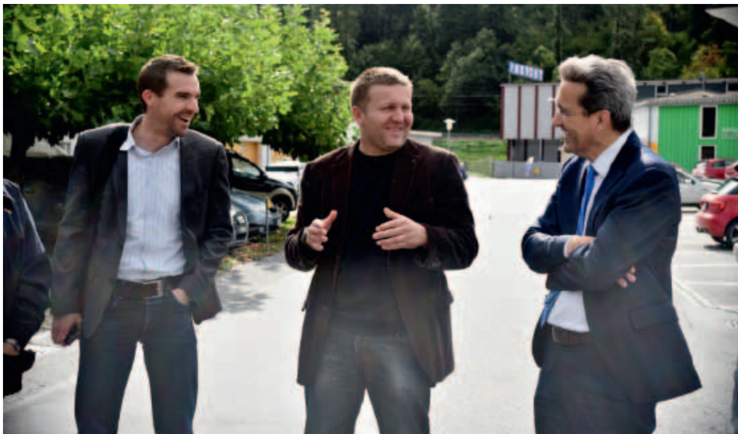
In Thisis fanden bereits viele wichtige Gespräche mit Sponsoren und Partnern vor Ort statt – hier beispielsweise mit zwei Vertretern der Hauptsponsoren.

In wenigen Wochen ist das Bündner Kantonturnfest bereits wieder Geschichte. So kurz vor dem Anlass wagen wir nochmals einen Blick auf den aktuellen Stand der Planung.