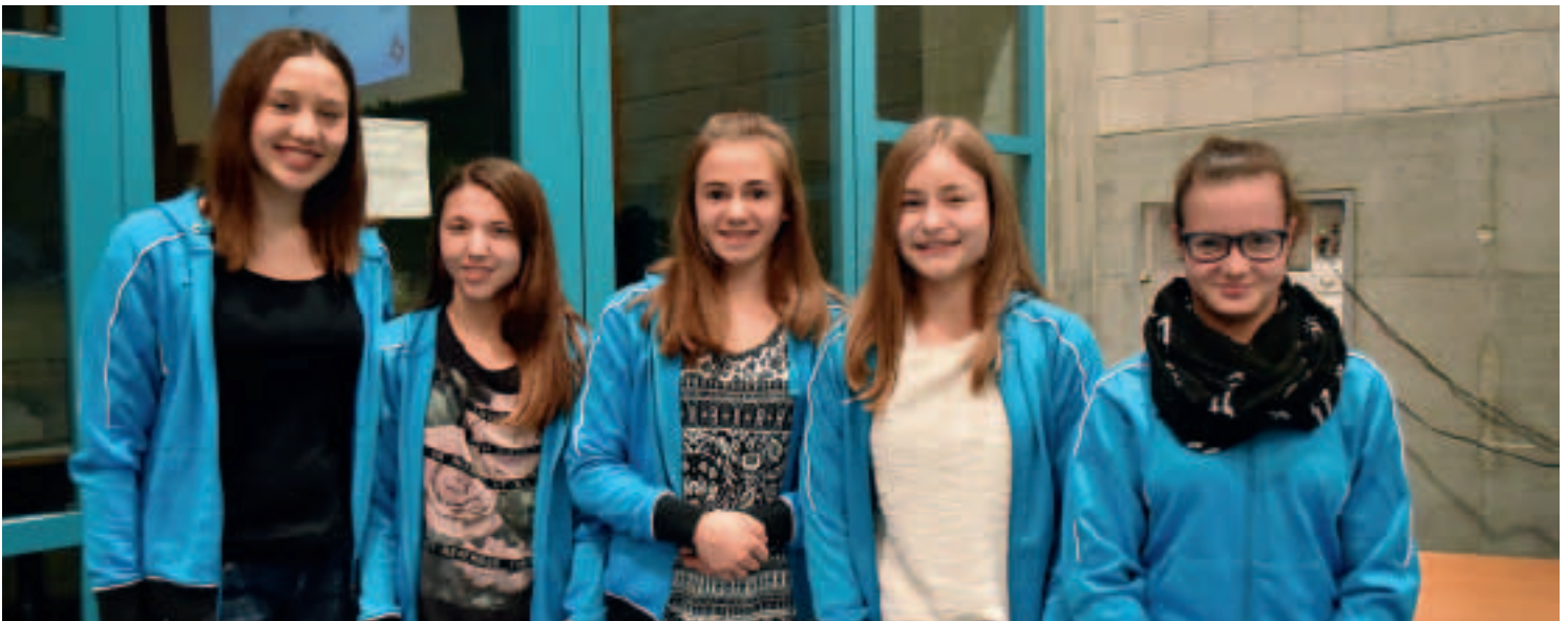
Für ihre tollen Leistungen an den Schweizer Meisterschaften wurden die Athletinnen der RG Chur (oben) und der Athletik Juniors Landquart (unten) geehrt.